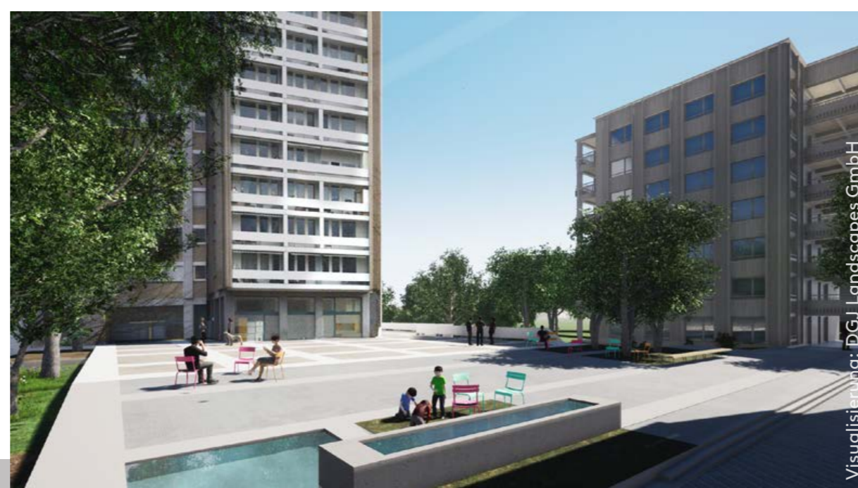
Erst in der Detailplanung wird definiert, wie der Quartierplatz genau ausgestattet wird.

Der bestehende Quartierplatz wird aufgewertet zu einem zentralen Platz für das ganze Quartier, wo Jung und Alt im Brunnen plantschen und sich auf den Bänken und mobilen Stühlen ausruhen kann.